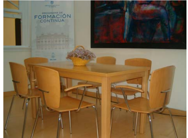
SALA DE PROFESORES: 2º ANDAR DO EDIFICIO