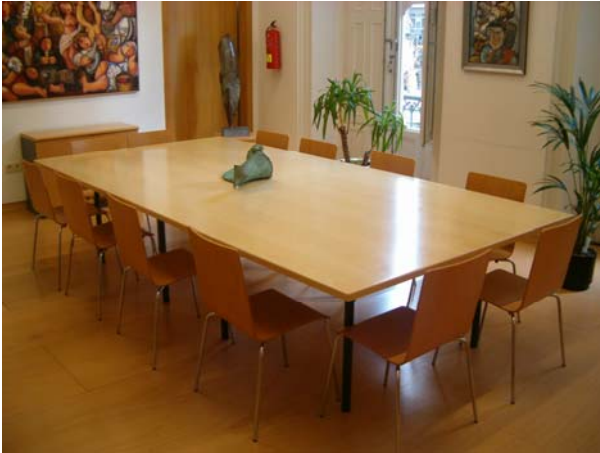
SALA DE XUNTAS: 1º ANDAR DO EDIFICIO